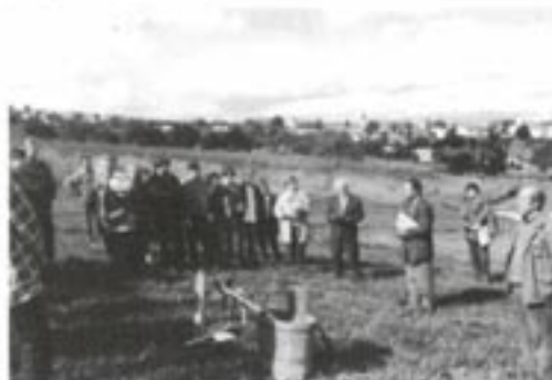
Ekologická olympiáda - práce v terénu

CHKO Bílé Krapaty. WWF podpořil práci KOSENKY s dětmi a mládeží, jedná se o akce typu ekologické olympiády, programy pro školy a pod.