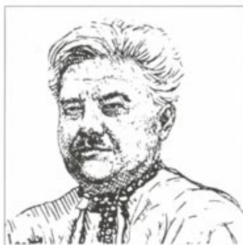
edici vyšly oba svazky „škrobákovských histerek“.