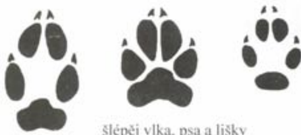
šlépěj vlka, psa a lišky

a proto setkání s jejími stopami přestává být vzácností. Stopa je velmi charakteristická, neboť je velmi široká s velkými prostory mezi jednotlivými, do vějíře roztaženými prsty.