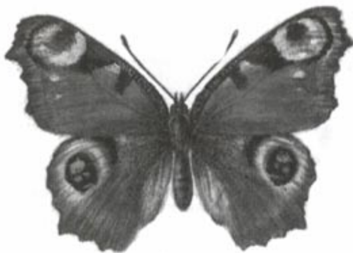
Babočka paví oko