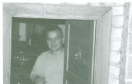
Vinný sklípek na Lopeníku

perspektivní, protože lidé budou vyhledávat klid. Myslím, že Kopanice jsou neobjevený kraj. Hlavně aby se tady udělala nějaká