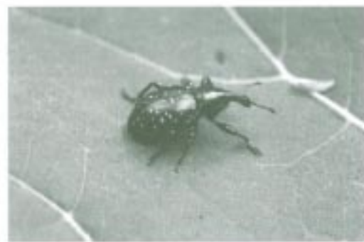
Tvrdoň devätsilový - klikoroh devätsilový

Aj keď sa mnohí ľudia chrobákov boja, resp. sa ich štíľa, možno práve tvrdoň devätsilový môže zmeniť postoj tých, ktorým chrobáky príliš napriarstli k srdcu. Skúste pri výlete do Bielych Karpát prekonať svoj odpor a položte si