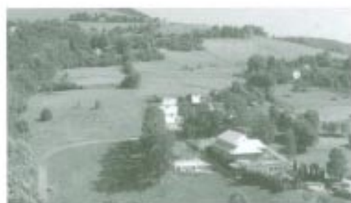
Rekreační středisko zapadá do malebné krajiny Kopanic.

„Zlepšovat služby. Perspektivy... já myslím, že je to tady