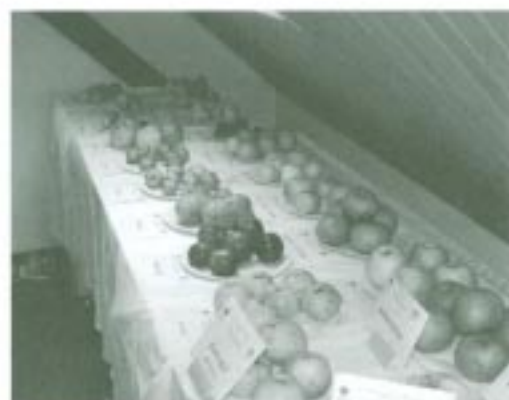
Výstava krajových odrůd jablek

V bloku Legislativa se podrobně hovořilo o zákonech, se kterými se lze při podobných projektech setkat. O možnostech financování záchrany starých ovocných odrůd informovali zástupci Státního fondu životního prostředí a Ministerstva životního prostředí.