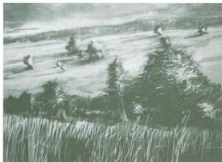
Čertoryje (Antonín Mach)