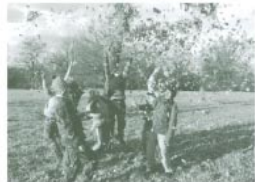
Nejlépeší obranou proti strachu z ptačí chřipky je radost ze života.

hlavou mi letělo hejno hus. K mému úžasu jsem zjistila, že se nejspíš jedná o 32 hus sněžních. Pokud je to pravda, bylo by to velmi výjimečné pozorování, a já doufám, že tento fakt ještě rozpoutá mezi ornitology patřičnou diskuzi. V každém případě to byl jedinečný zážitek, jaký se člověku stane několikrát za život. Uvědomila jsem si, jaká nenahraditelná ztráta by to byla, kdyby právě tyto husy na někde hranicích zastřelili jen proto, aby ověřili, zda náhodou nepřenášejí virus ptačí chřipky. Divocí ptáci mají