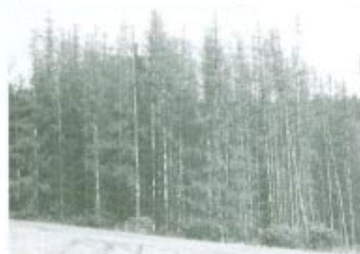
Smrkový porost napadený károvcem

Smrk má nezastupitelný význam v horských lesích ve smrkovém lesním vegetačním stupni, na horní hranici stromové vegetace, ale také jako hospodářská dřevina mimo chráněná území. Příměs smrku v listnatých porostech se vyskytuje již v nadmořských výškách kolem 900 m n. m. V Bílých Karpatech se v přirozené druhové skladbě vy-